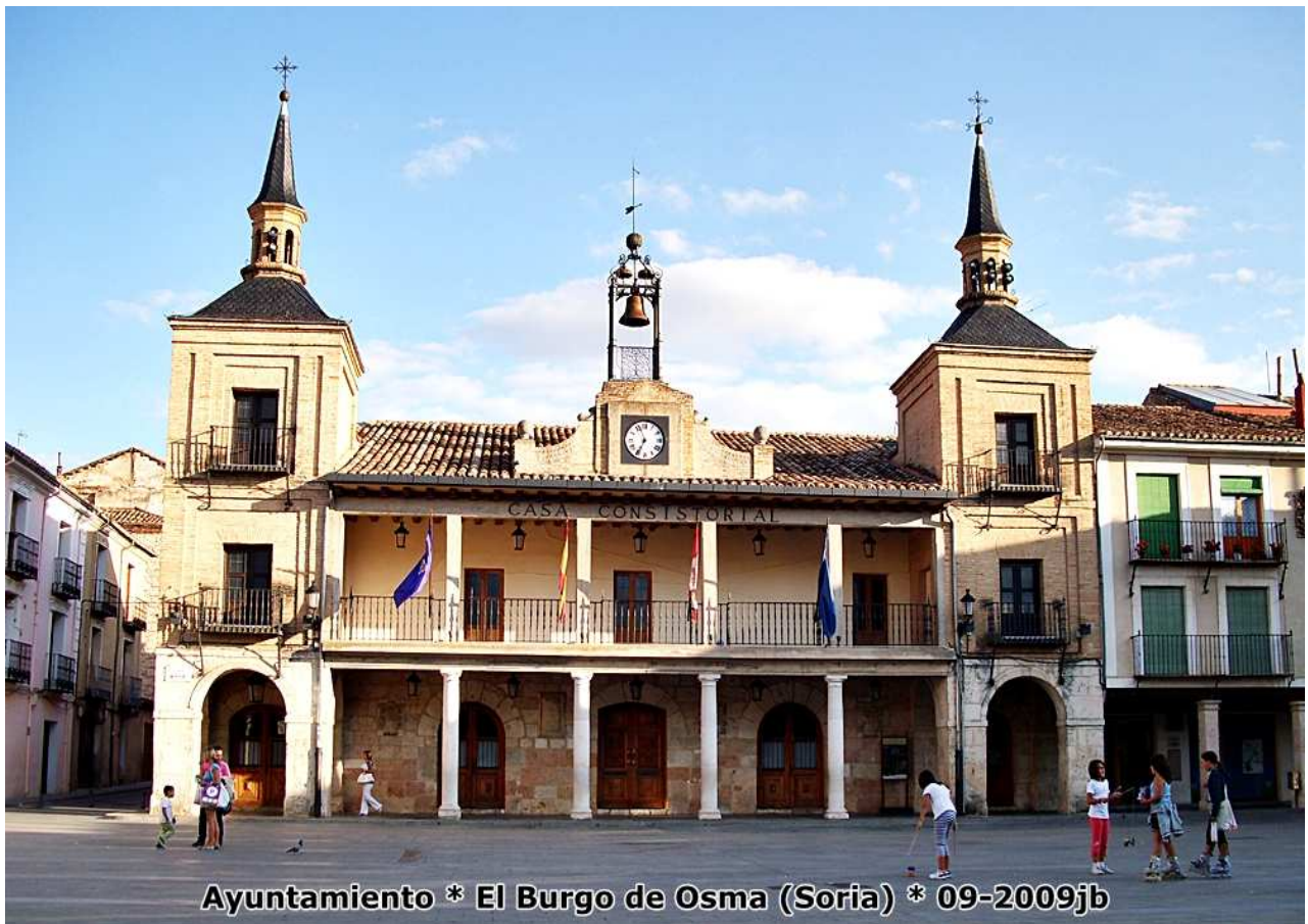
Ayuntamiento * El Burgo de Osma (Soria) * 09-2009jb

La Calle Mayor es porticada y conduce a la Plaza Mayor con soportales, donde está el Ayuntamiento del S. XVIII; el Hospital de San Agustín (antiguo), barroco del S. XVII con fachada tipo alcázar, con dos torres achapiteladas, planta cuadrada y patio central grande - hoy es Centro Cultural -; el Palacio Episcopal con portada tardogótica y fachada de mampostería, también veremos el Seminario , diseñado por Sabatini. La Universidad de Santa Catalina : Renacentista del S. XVI, construido por orden del Papa Julio III con portada plateresca, un bonito patio central y portada plateresca. Aquí estudió Gaspar Melchor de Jovellanos. Es claramente distinto al núcleo medieval.