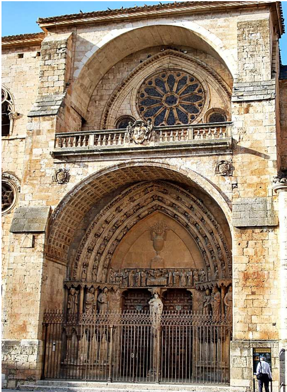
Catedral de la Asunción*El Burgo de Osma (Soria) 09-2009jb