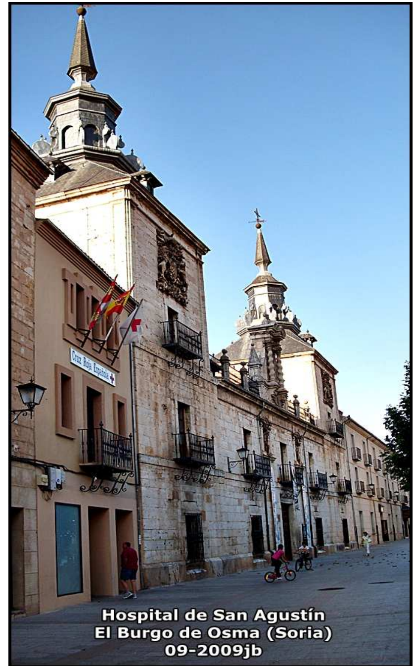
Hospital de San Agustín El Burgo de Osma (Soria) 09-2009jb